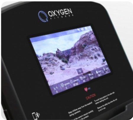
7-ми дюймовый сенсорный цветной TFT дисплей