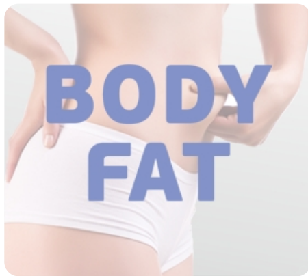
Режим жиранализатора Body Fat для определения комплекции организма