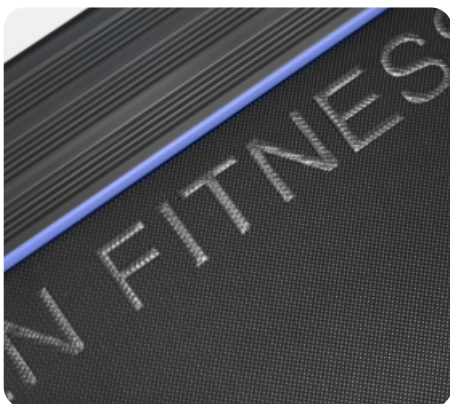
Многослойное полотно Habasit NVT-218 (толщина 1.8 мм)