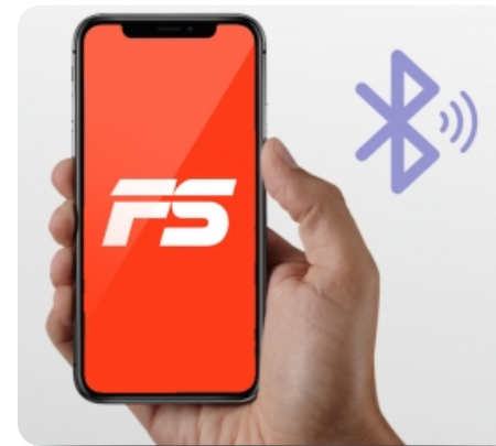
Синхронизация оборудования с мобильным приложением FitShow