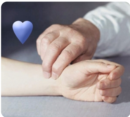
3 пульсозависимые программы