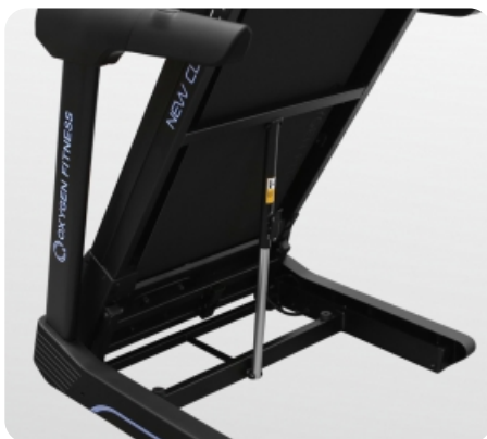
Легкое складывание за счет двухфазной гидравлики easyFOLD™