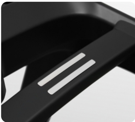
Сенсорные датчики пульса