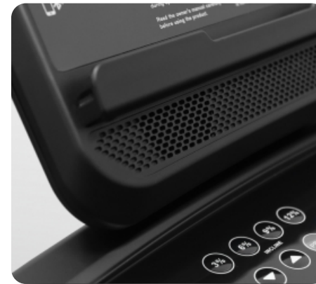
Встроенные динамики мощностью 3 Ватт