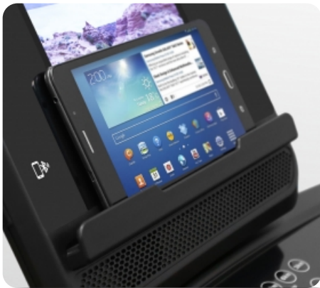
Подставка для гаджетов