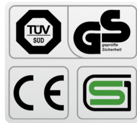
Обязательные сертификаты: европейский CE, немецкий GS TÜV, японский SG