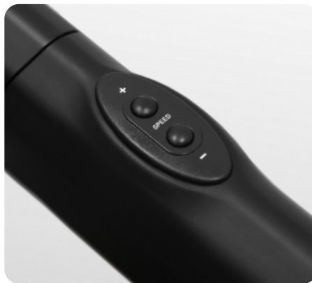
Дополнительные кнопки переключения наклона и скорости