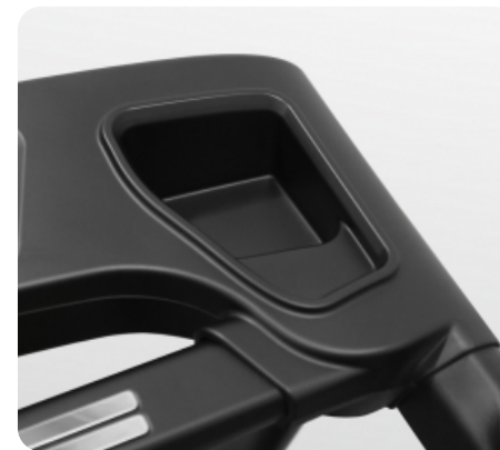
Подставка под бутылочку с водой