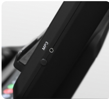
Воспроизведение аудио при помощи AUX