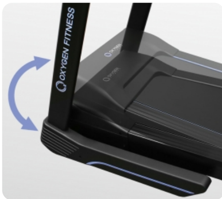
Электрически изменяемый угол наклона от 0 до 18%